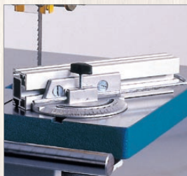
PPS 740, 840