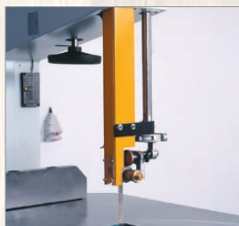
PPS 740, 840